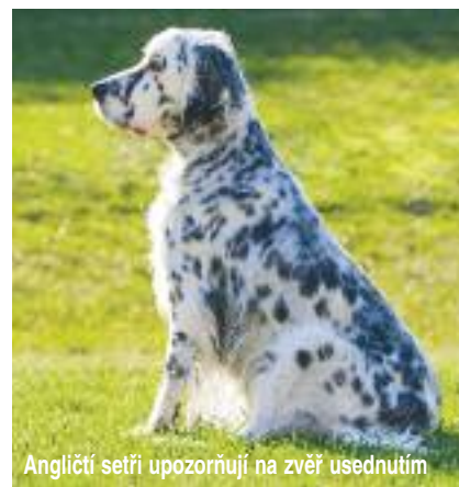
Angličtí setři upozorňují na zvěř usednutím

Pes, na britských ostrovech vznikla křížením těchto slídičů se španělským ohařem (spanish pointer) skupina setrů. V další linii probíhalo šlechtění směrem k retrívrům. Pro ohaře, kteří byli vyšlechtěni i pro vodní práce, zejména dohledávání zvěře v rákosí a její přinášení, se vžil název griffon. Dodnes se zachovalo několik plemen, u kterých není možné přesně rozlišit, jestli patří spíše mezi honiče, nebo už ohaře – jako například španělský ohař nebo portugalský ohař. S pojmenováním ohař či ohařík se můžeme setkat už ve středověké „lovecké“ literatuře, nicméně nejednalo se ještě o moderní stavěcí psy, jak je známe dnes. Jednotlivá plemena ohařů se vymezila až ve druhé polovině 19. století. V té době se ve střední Evropě cílevědomě snižovaly stavy velké zvěře a vybíjely se velké šelmy. Současně docházelo k rozvoji chovu drobné zvěře – zajíců, bažantů a koroptví. Tak vznikla i poptávka po loveckých psech nového typu. Ti se od svých předchůdců lišili zejména způsobem práce při lovu: starší honiči a španělé zvěř označovali štěkáním nebo štváním, na rozdíl od nich ale „noví“ ohaří upozorňovali potichu – zaujetím typického strnulého postoje nebo usednutím (setří), popřípadě ulehnutím.