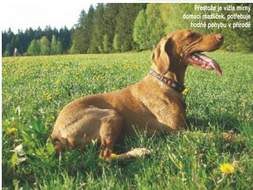
Přestože je vižla mírný domácí mazlíček, potřebuje hodně pohybu v přírodě

Text: Mirka Koničková