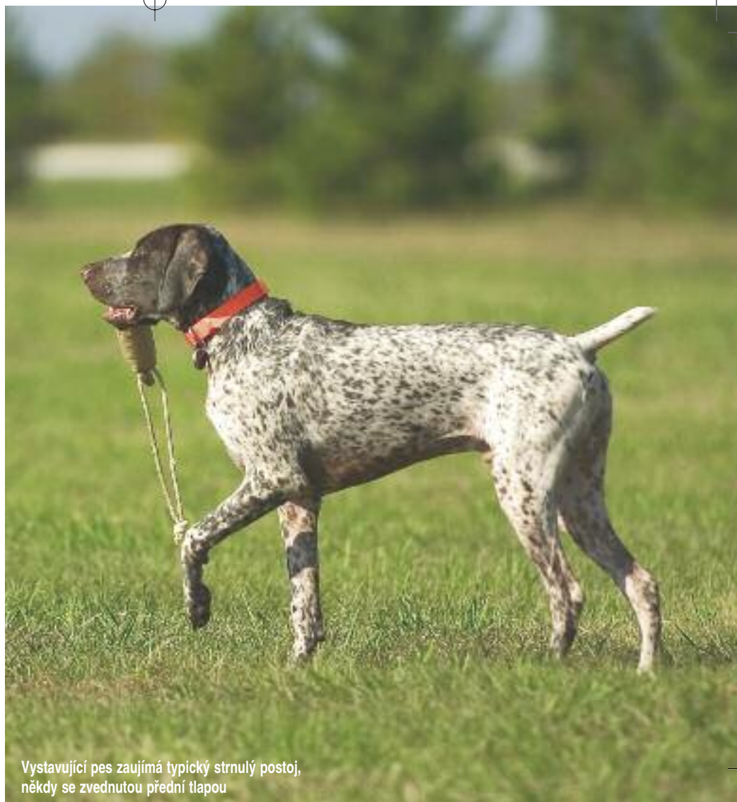
Vystavující pes zaujímá typický strnulý postoj, někdy se zvednutou přední tlapou

V souvislosti s prací ohařů se setkáváme s řadou termínů, které vycházejí z takzvané myslivecké latiny,