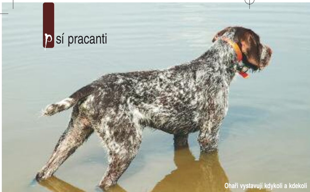
Ohaří vystavují kdykoli a kdekoli